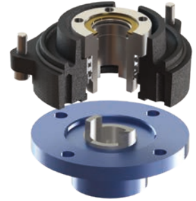
Forme · Form C

Alésage claveté (Ø20 mm max.). Fixation par quatre trous taraudés M10 (profondeur 20 mm) ou quatre trous taraudés M8 (profondeur 15 mm) Small keyed bore (Ø20 mm max.) Connection with four M10 threaded holes (depth 20 mm) or four M8 threaded holes (depth 15 mm)