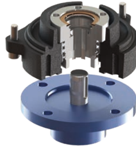
Forme · Form B3

Boîte à écrou pour grand alésage (Ø42 mm & hauteur 48mm max.). Fixation par quatre trous taraudés M10 (profondeur 20 mm) ou quatre trous taraudés M8 (profondeur 15 mm) Drive bush for large keyed bore (Ø42 mm & height 48 mm max.) Connection with four M10 threaded holes (depth 20 mm) or four M8 threaded holes (depth 15 mm)