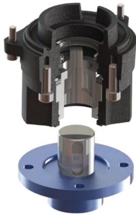
Forme · Form B1

Boîte à écrou pour tige de vanne fileté (Ø25 mm max.). Fixation par quatre trous taraudés M10 (profondeur 20 mm) ou quatre trous taraudés M8 (profondeur 15 mm) Drive bush for threaded valve stem (Ø25 mm max.) Connection with four M10 threaded holes (depth 20 mm) or four M8 threaded holes (depth 15 mm)