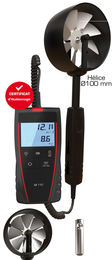
Hélice Ø100 mm Hélice Ø70 mm Hélice Ø14 mm