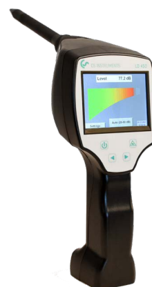
LD 450 avec tube de focalisation pour une localisation très précise